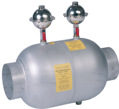
▲ Micro Bubble Luftabscheider funktionieren auch mit herkömmlichen Entlüftern