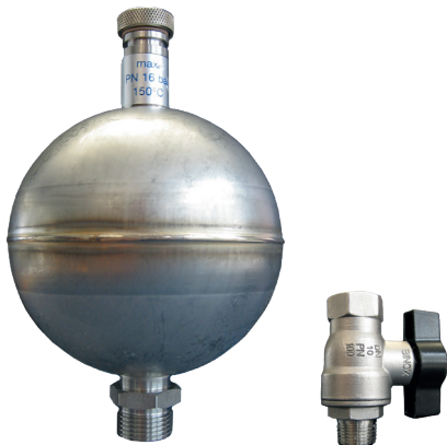
▲ Entlüfter und Absperrventil aus Edelstahl